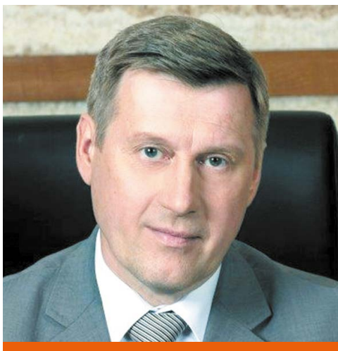
МЭР ГОРОДА НОВОСИБИРСКА АНАТОЛИЙ ЕВГЕНЬЕВИЧ ЛОКОТЬ

Мы верим в то, что молодое поколение нашего города будет достойно нести звание патриотов России, умножит славные традиции старших поколений сибиряков. Пусть подвиг отцов и матерей, завоевавших для нас мирную жизнь, всегда будет примером мужества, добра и справедливости.